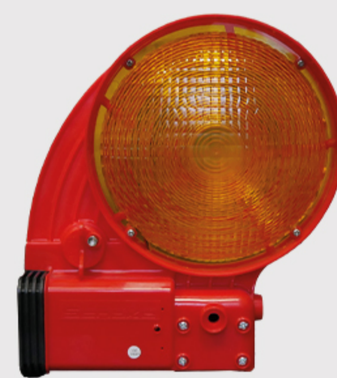
BAST Bakenleuchte Powernox

mit LED Technik, zur Anbringung an BAST Wendebake Typ NOX und an alle gängigen Sicherheitsbaken und Schrankenzaun mit integriertem Batteriekasten – seitlicher Batteriewechsel – (Patent) und Dämmerungsautomatik, BAST-geprüft