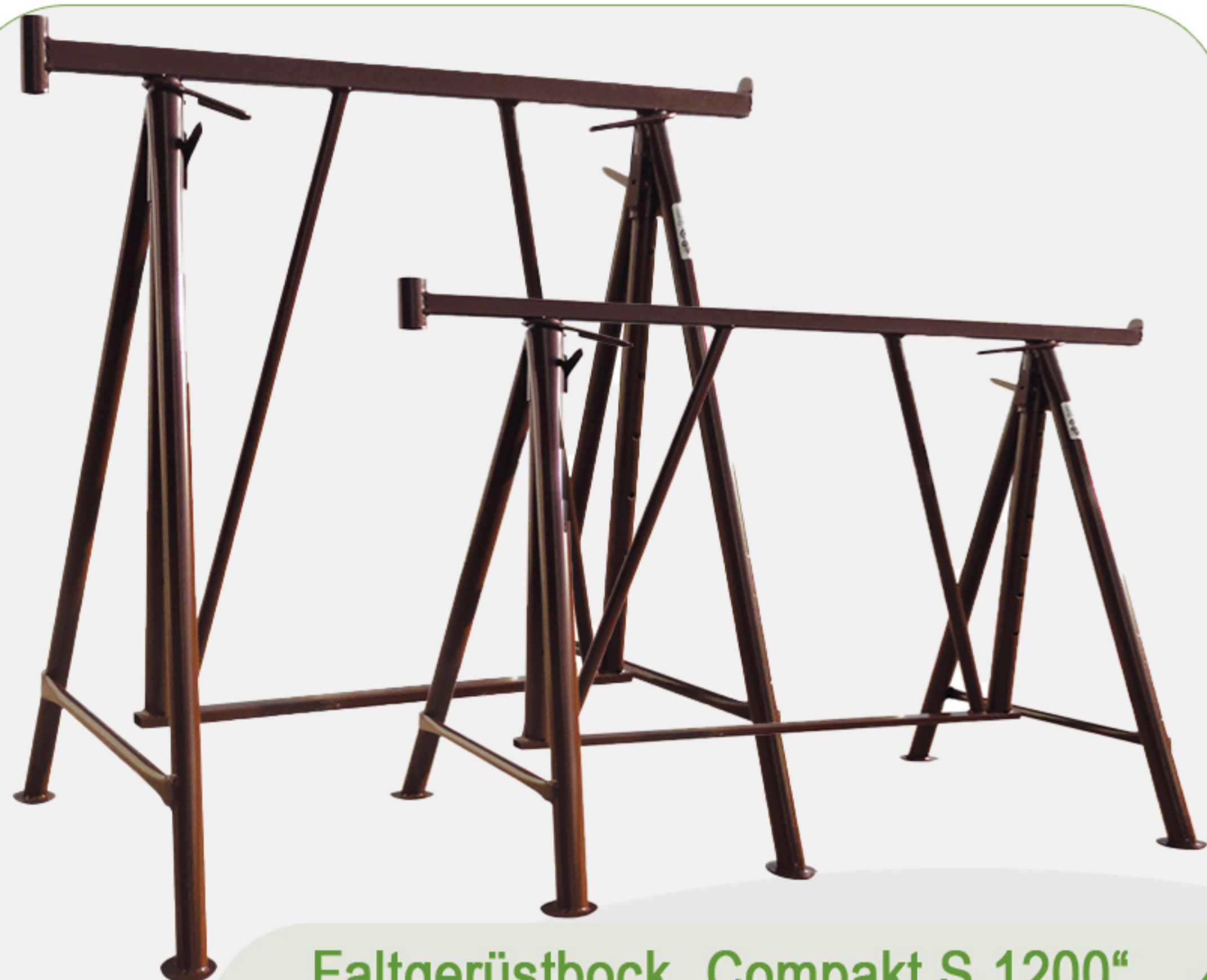
Faltgerüstbock „Kompakt S 1200“

stabile Stahlkonstruktion mit Auflagetraverse aus 40 mm x 40 mm Vierkantrrohr sowie seitlich angeschweißter Rohraufnahme für Geländerpfosten und Anti-Absturzblech; beide Standfüße (aus Ø 42 mm Rundrohr), Breite: 1,20 m, Tragkraft: 1500 kg